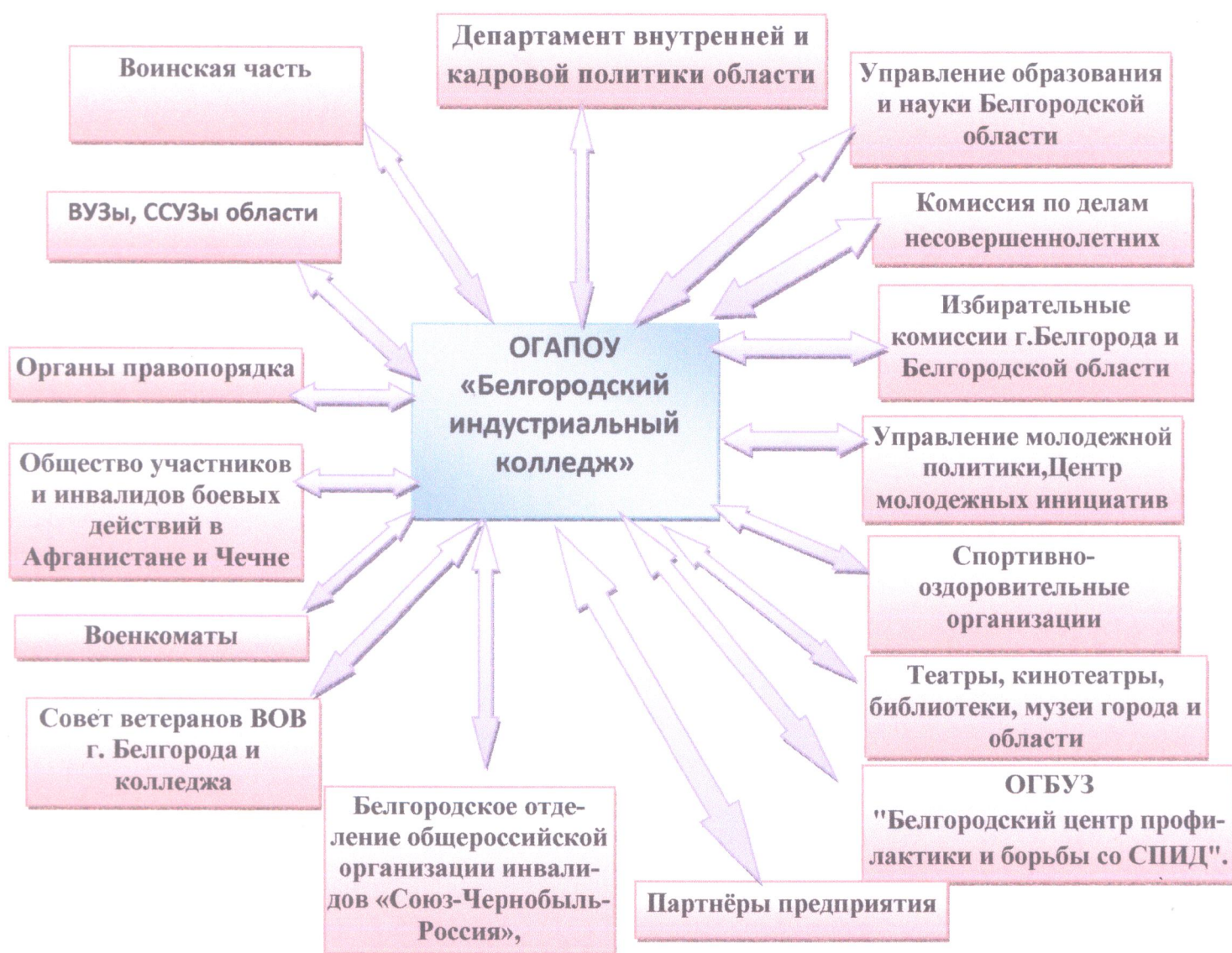
Схема Социального партнерства