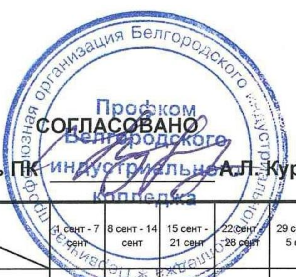
ГРАФИК УЧЕБНОГО ПРОЦЕССА ОГАПОУ "БЕЛГОРОДСКИЙ ИНДУСТРИАЛЬНЫЙ КОЛЛЕДЖ" НА 2017 - 2018 УЧЕБНЫЙ ГОД