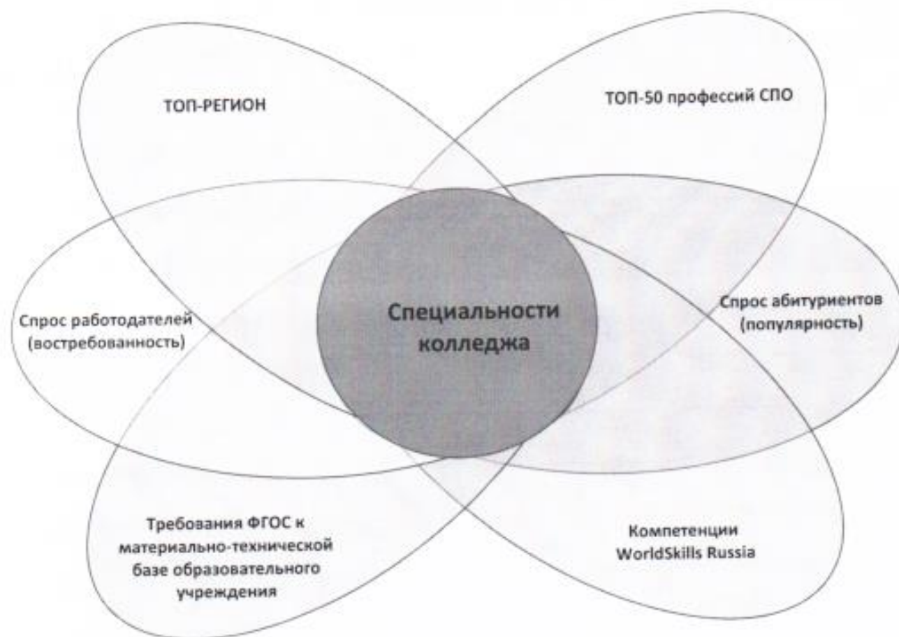
Рисунок 1 – Направления мониторинга специальностей