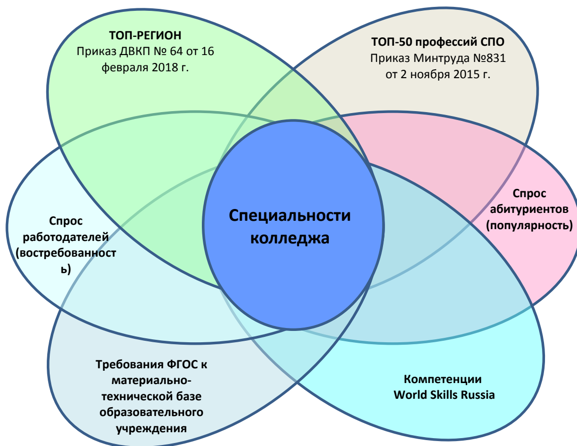
Рисунок 1 – Направления мониторинга специальностей Результаты анализа по данным критериям обобщены в Таблице 2.

- соответствие состояния материально-технической базы колледжа требованиям ФГОС по соответствующей специальности.