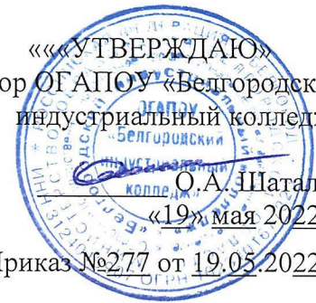
ГРАФИК защиты выпускных квалификационных работ по специальности 13.02.11 Техническая эксплуатация и обслуживание электрического и электромеханического оборудования по отраслям отделения «Электроэнергетики, теплотехники и сварочного производства» в 2021/2022 учебном году