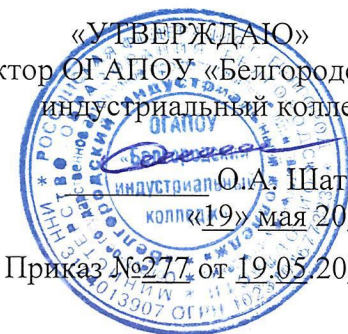
ГРАФИК защиты выпускных квалификационных работ по специальности 13.02.02 Теплоснабжение и теплотехническое оборудование отделения «Электроэнергетики, теплотехники и сварочного производства» в 2021/2022 учебном году

О.А. Шаталов «19» мая 2022 г. Приказ №277 от 19.05.2022 г.